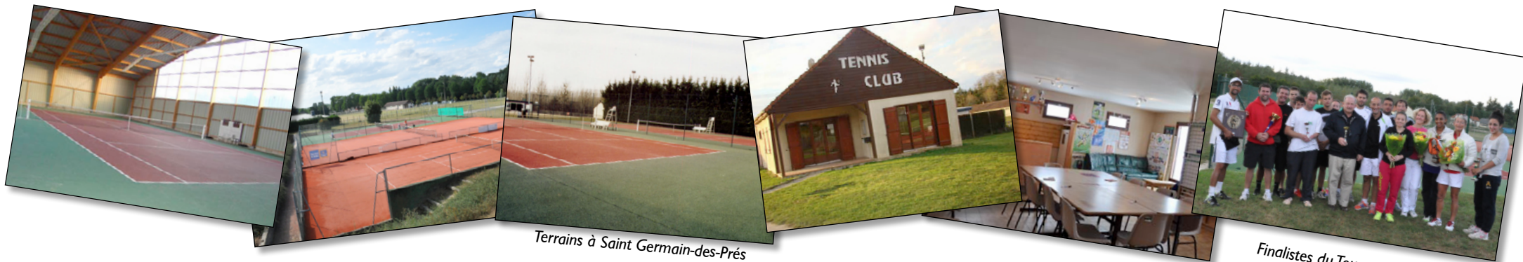
Terrains à Saint Germain-des-Prés